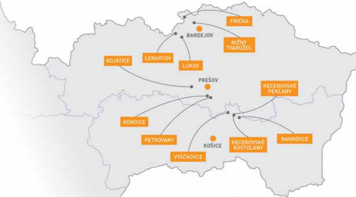
Projekt DOM.ov v lokalitách (2016)

V roku 2016 Projekt DOM.ov mapoval kvalitu bývania a potreby obyvateľov v jedenástich rómskych lokalitách a vyhodnocoval potenciálne dopady svojpomocnej výstavby nízkonákladových domov z mikropôžičiek na správanie obyvateľov i samospráv.